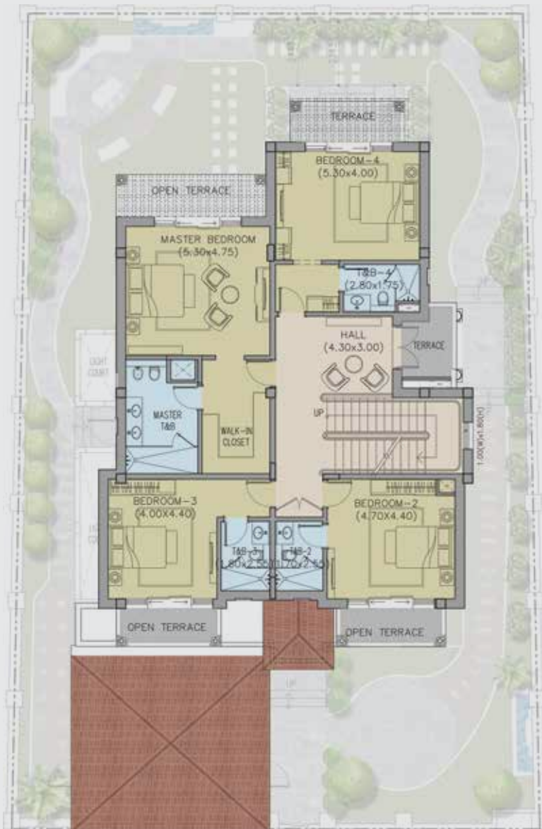
مخطط الدور الأول First Floor Plan