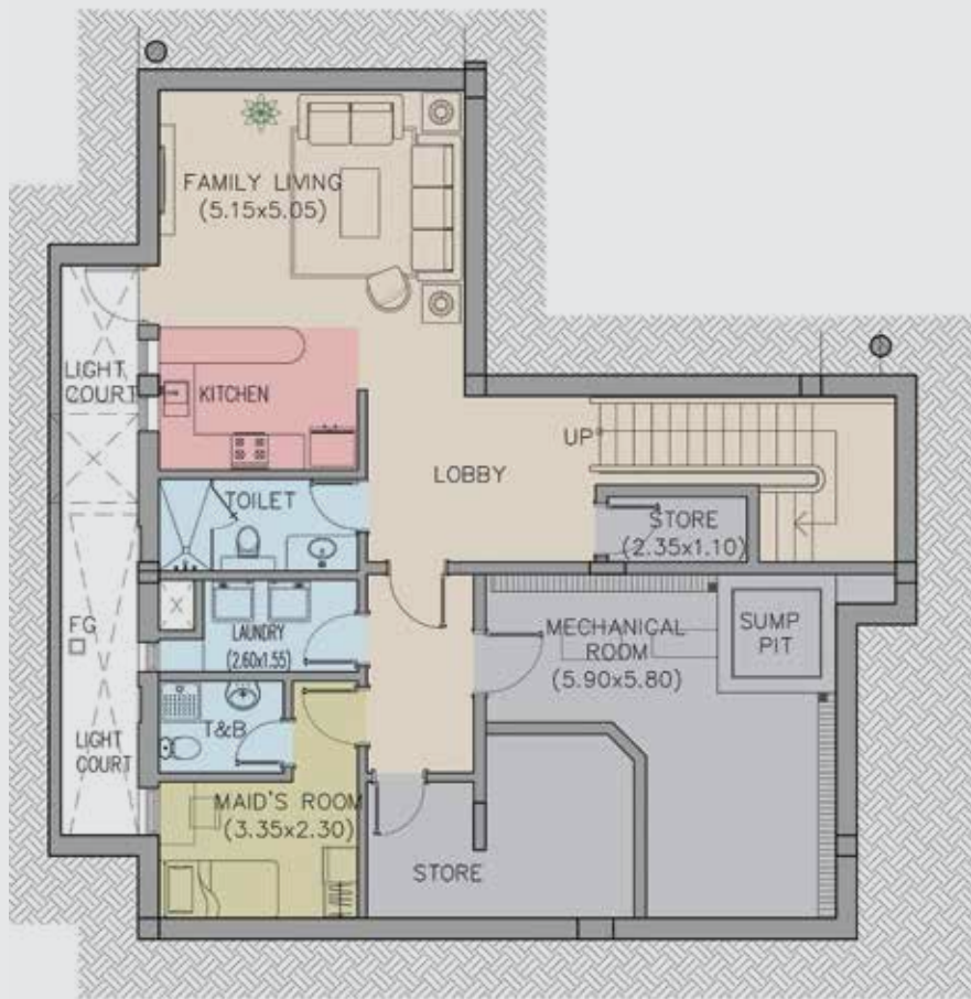
مخطط الدور السفلي Basement Floor Plan