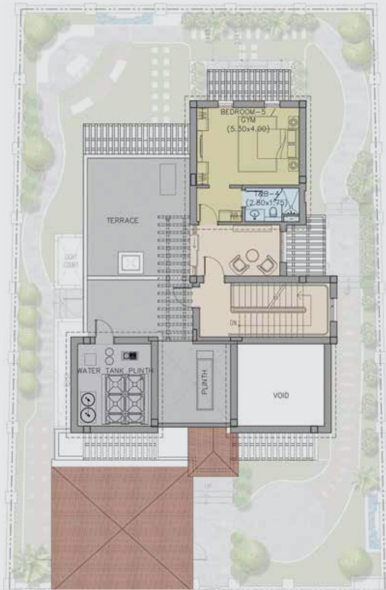
مخطط البنتهاوس Penthouse Floor Plan

إخلاء مسؤولية البائع بشأن مخططات الطوابق/الوحدات السكنية يقر ويوافق المشتري بأن جميع رسومات مخططات الطوابق/الوحدات السكنية هي بغرض إيضاح المخطط التصوري للمبنى فقط، وبالتالي هي رسومات قد تكون خاضعة للتغيير دون إشعار، وفقاً لتقدير المطور. يحتفظ المطور بحق إجراء التعديلات أو إدخال إضافات أو حذف على مخطط الطابق في هذا الكتيب دون إخطار مسبق، بوصفه المطور، وذلك بما يراه مناسباً أو مرغوباً فيه. الأبعاد بحسب المساحة بالمتر المربع هي للقياس التقريبي ويمكن أن تختلف بما نسبته ٥٪ عن واقع مجسم البناء الفعلي. جميع الصور هي لأغراض التوضيح فقط ولا تمثل الحجم والميزات والمواصفات والتجهيزات والمفروشات الفعلية. تباع الوحدات غير مفروشة.