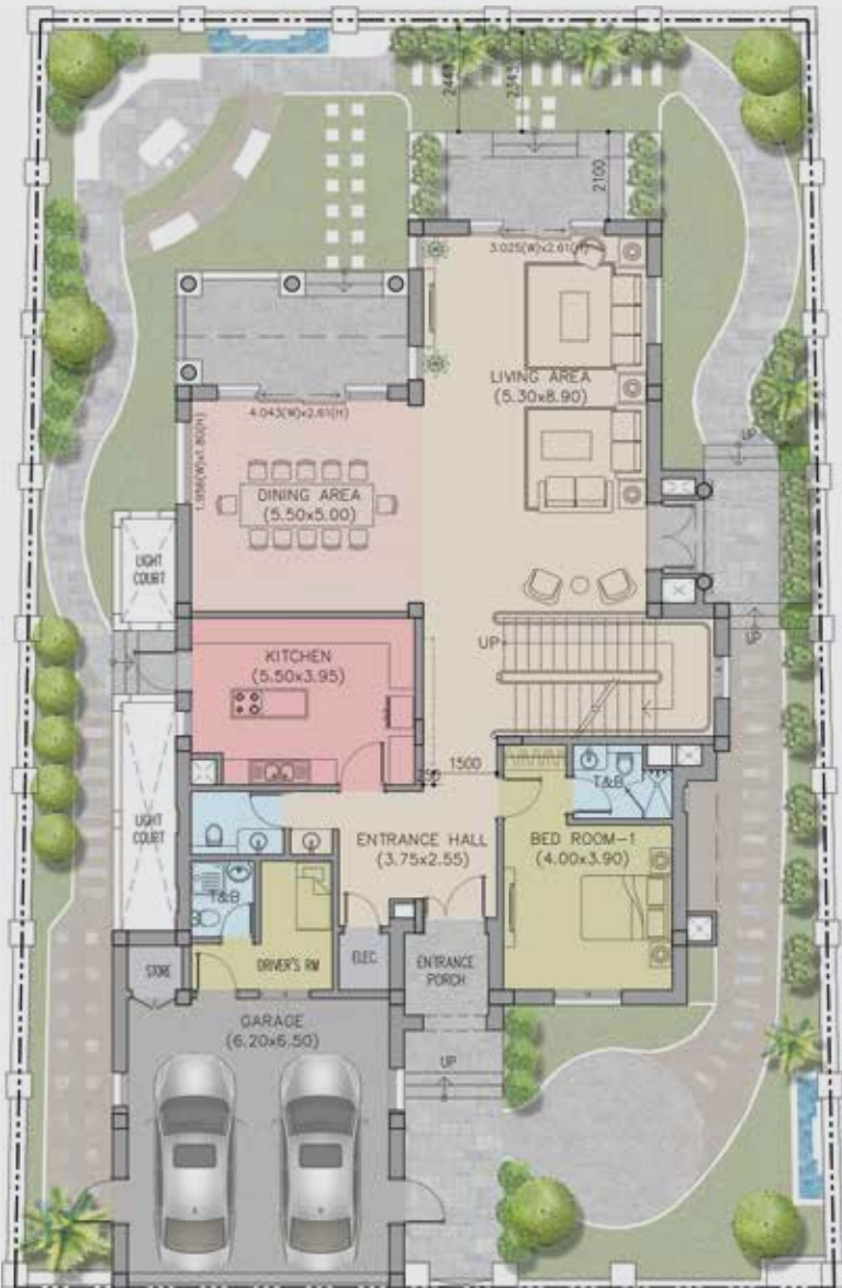
مخطط الدور الأرضي Ground Floor Plan